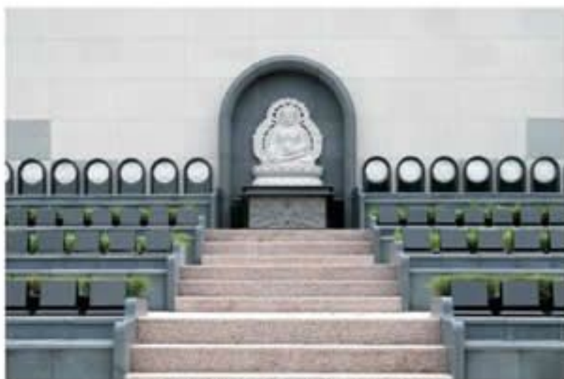
【佛陀園區】佛祖與拜桌