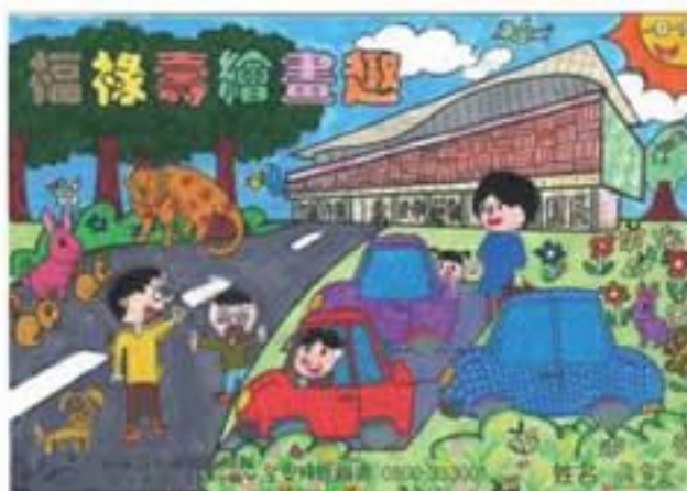
福祿壽繪畫趣 / 張家宸