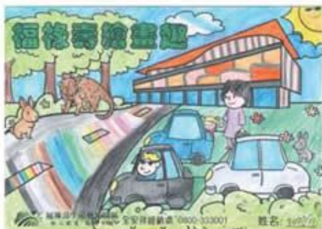
福祿壽繪畫趣 / 李昀翰